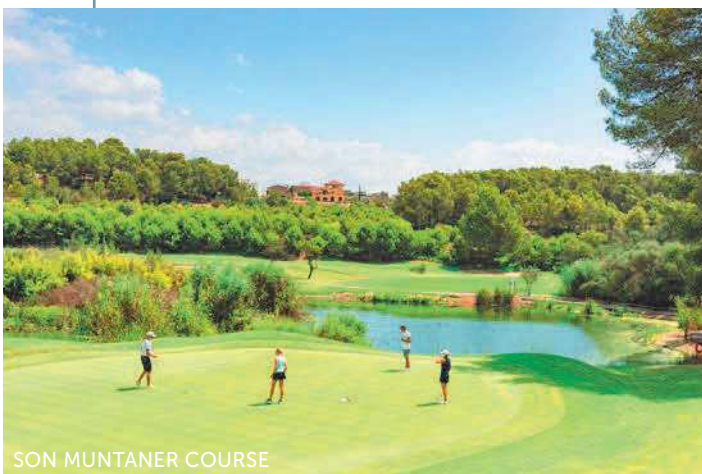
SON MUNTANER COURSE

Emerald Sakara: eine Luxusyacht mit Kurs auf das Mittelmeer. Mit ihr sticht 2023 das zweite Hochsee-Schiff der Flotte von Emerald Cruises in See. Gemeinsam mit uns können Sie erstklassige Golfplätze während der Reise spielen und den Luxus einer Kreuzfahrt mit maximal 100 Gästen an Bord genießen. Wir freuen uns Sie an Bord begrüßen zu dürfen!