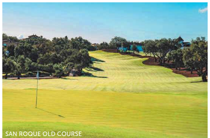
SAN ROQUE OLD COURSE